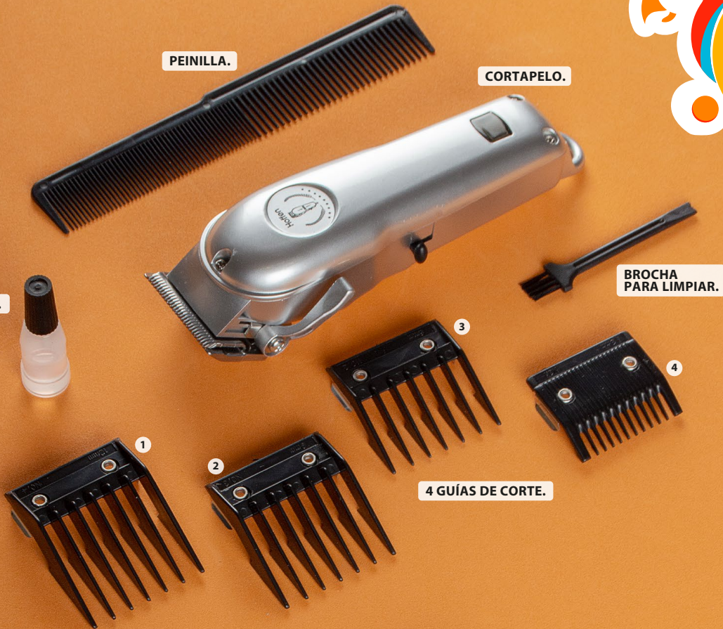
4 GUÍAS DE CORTE.

CORTAPELO. PRECIO DE MERCADO: $89.990 10.000 UNIDADES*