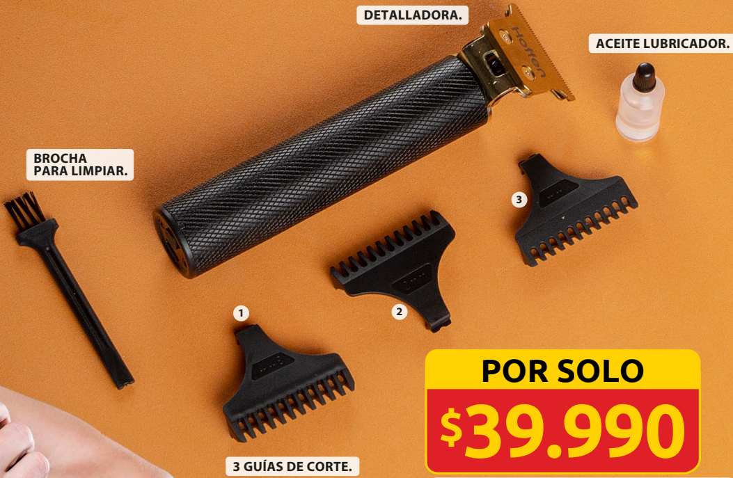
3 GUÍAS DE CORTE.

MÁQUINA DETALLADORA. PRECIO DE MERCADO: $59.950 10.000 UNIDADES*